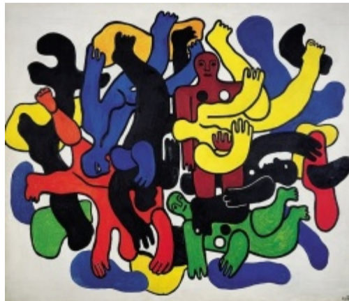
les grands baigneurs noirs

6- faire le contour : on a déjà vu que l'on pouvait faire le contour des formes pourquoi ne pas faire dans du carton un bonhomme ( prendre les emballages de céréales ...) et reproduire cette forme humaine autant de fois que désiré comme Fernand Léger