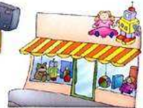
le magasin de jouets