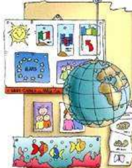
la carte géographique