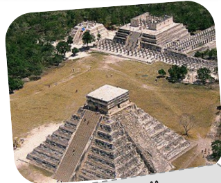
Pyramide au Mexique

Les Amérindiens sont les premiers habitants de l'Amérique du Nord et chaque tribu possède sa propre langue, ses traditions et son style vestimentaire.